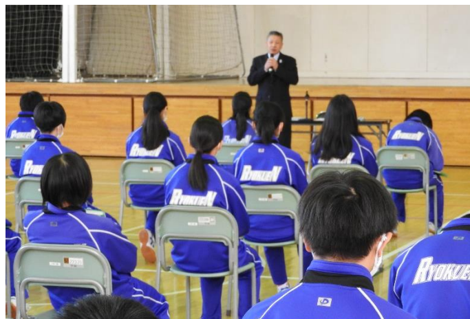
【3学年 薬物乱用防止教室のようす】

“2月は逃げ、3月は去る”の通り、あっという間に過ぎていった三学期でした。そして3年生は受験を終え、いよいよ卒業までのカウントダウンの時期となりました。残り少ない緑園中での日々思い出を刻んでいって下さい。そして1、2年生も、式には出席できませんが当日に向けて全校一体となって、3年生を送り出す雰囲気、心から創ってほしいと思います。