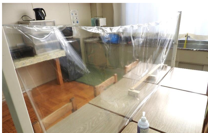
学校長、金井教諭による手作りの 各普通教室にある感染対策用のシールドです。