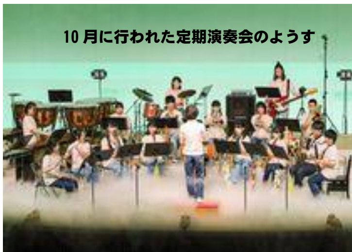
10月に行われた定期演奏会のようす