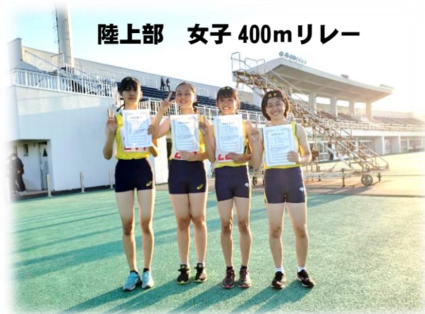
陸上部 女子 400mリレー