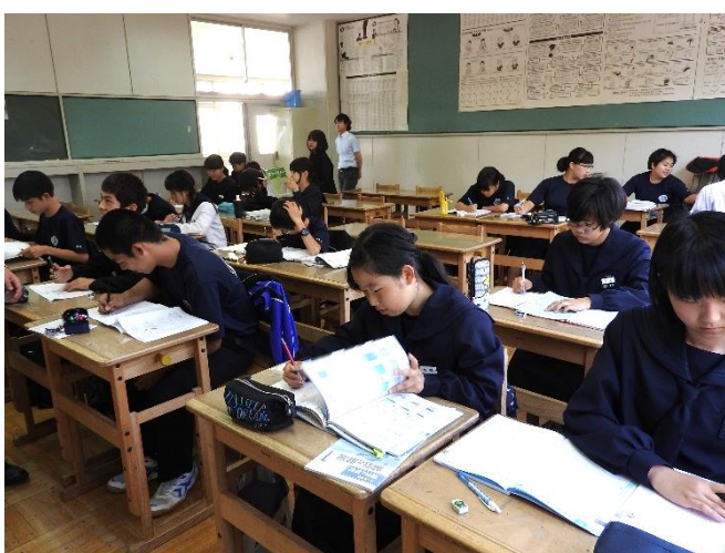
6月20日（木）放課後自習室のようす

緑園中学校では、学力向上のためと、個々のニーズに対応することを目的に、次のような取り組みを行っています。