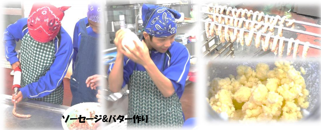
ソーセージ&バター作り

一つ一つの経験が豊かな人生を生きる糧になることでしょう。講師となっていたいただいた地域の方々への感謝を忘れないようにしてほしいものです。