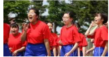
＜力強い応援＞ 全力で仲間を応援している様子

体育祭の様子は、学級通信などで詳しい様子を紹介していますが、子どもたちの姿をご覧いただき、今後、懇談会や学校評価等で感想をいただくと幸いです。