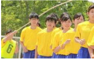
＜大縄とび＞ 学年が上がる毎に難易度が高くなる種目、心一つに跳ぶ3年生の姿

だき、本当にありがとうございました。子どもたちは挑戦することや仲間と関わることを通して、自分や仲間のことを深く考える機会となりました。