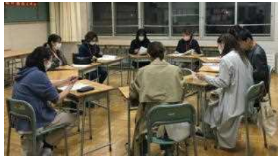
左：広報部 右：社会部