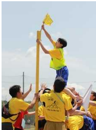
<女王君臨> 3年女子、力を合わせ旗を立てる様子

「それいけ！ 緑園魂 ～Rise to the top～」のテーマのもと、第32回体育祭を実施しました。コロナ禍を経て、改めて大切にしていた「密」な関わりを、4年ぶりに行うことができました。開催に伴い、PTAの皆様のご支援、地域施設の駐車場の借用、家庭でのご理解とご協力など、多くの支えによりこの日を迎えられたことを感謝しております。