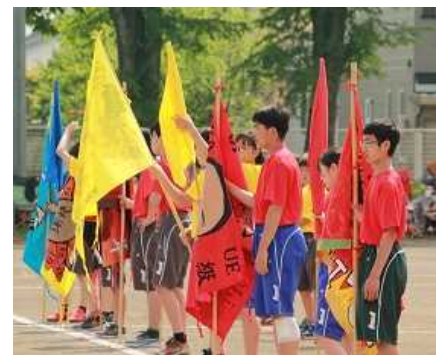
<開会式> 学級旗を掲げ、「選手宣誓」を行う様子

「 頑張ることは格好いい 」「 心を一つに揃えることは素敵なこと 」を体現し、チームのために仲間と流す汗、こぼれる笑顔は、眩しく、キラキラと輝いていました。一人一人が役割を果たそうと努力し、励まし合い、力を合わせて作り上げた体育祭は全員が主役でした。